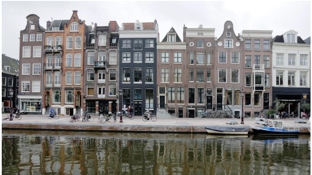
Nieuwe walmuur Prinsengracht

Gebied Zuid wordt begrensd door de Amstel, Singelgracht, Leidsegracht en het Singel. Het gebied kenmerkt zich door de combinatie van verschillende functies: hier wordt gewoond, gewerkt en gerecreëerd. Werken heeft de overhand boven wonen: in gebied Zuid zijn ruim 20.000 mensen werkzaam en er wonen rond de 12.000 mensen. In de grachtengordel bevinden zich naast woonhuizen diverse grote kantoorpanden. De unieke grachtengordel maakt onderdeel uit van het UNESCO Werelderfgoed en trekt veel toeristen. Bezoekers worden gefaciliteerd door de vele hotels en andere horecazaken in gebied Zuid. Restaurants, cafés en clubs zijn vooral te vinden op en rondom de grote uitgaansgebieden van Amsterdam: het Leidseplein en Rembrandtplein. Het Leidseplein is een nationaal bekend uitgaansplein met de grootste cultuurconcentratie van Amsterdam, variërend van theaters en muziekpodia tot bioscopen en casino's. Bij het Rembrandtplein, Thorbeckeplein en de Reguliersdwarsstraat zijn naast veel nachthoreca, de bioscopen Tuschinski en Pathé de Munt, diverse hotels te vinden. Deze uitgaansgebieden hebben grote invloed op het functioneren van en het leefklimaat in het deelgebied.